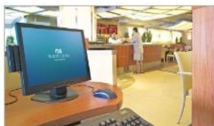
Internet Café & Library