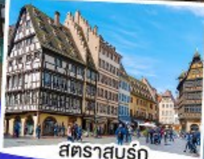
สตราสบูร์ก