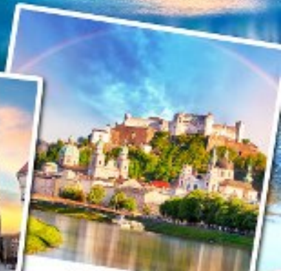
ซาลส์บวร์ก