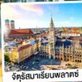
จัตุรัสมาเรียนพลาตซ์