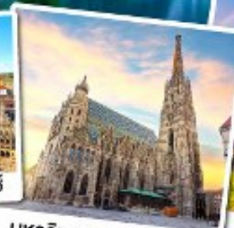
มหาวิหารเซนต์สตีเฟน