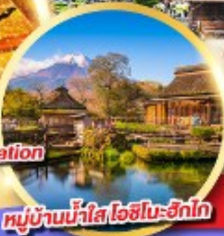
หมู่บ้านน้ำใส โอชิโนะฮัทไก