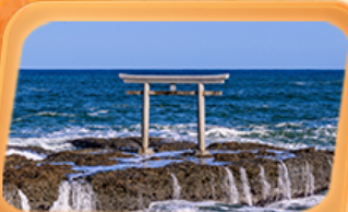
ศาลเจ้าโองาโรอิโซซึกิ

แพคเกจพิเศษ "ฟูจิซัง" ที่หมู่บ้านโอชิโนะ อักโท สวนโออิชิปาร์ค ที่เที่ยว Unseen นั่งกระเช้าชมวิวภูเขาฟูจิ ทะเลเจ้าโองาโรอิโซซึกิ ศาลาโทริอิริมทะเล อลังการโบสถ์เปลี่ยนสี น้ำตกเคงอน ศาลาเจ้านิคโกโทโชกุ เสริมมงคล วัดพระใหญ่อุซึคุ โดบุคสี ห้ามพลาดโคมแดงยักษ์ วัดอาซากุสะ อิมมอร์ทัลตลาดปลาโทโยสุ ภัตตาคารแนว 3D ย่านชิจูกุ ซุปบิงจูกุย่านดังชิบูย่า