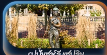
รูปปั้นชาร์ลี แชปลิน

เที่ยวครบจบทุก Highlight ตะลุยจุดเพรา วิวดั้งการจัดเต็มสมชื่อ Top Of Europe สักครั้งในชีวิตหมู่บ้านเซอร์แมท นั่งรถไฟสาย Gornergrat bahn หมู่บ้านเลาเทอร์บรุนเป็นสวยเหมือนเทพนิยาย เปิดประสบการณ์โรแมนติกส่องเรือทะเลสาบรุน ทะเลสาบเจนีวา น้ำพุจรดเจกโค ศาลาไทย รูปปั้นชาร์ลี แชปลิน The Fork ปราสาทซิลยอง หมู่บ้านอิซลทอวอลด์ สิงโตแกะสลัก สะพานไม้ชาเปล โบสถ์ฟรอนนุสสเตอร์ ซ็อบบิงจุงถนนบานโฮฟชตราเซอร์