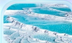
ปราสาทปุยฝ้าย