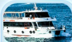
ล่องเรือ ช่องแคบบอสฟอรัส