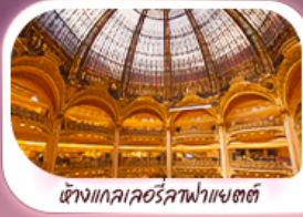
ตึกแกลเลอรีลูฟวร์