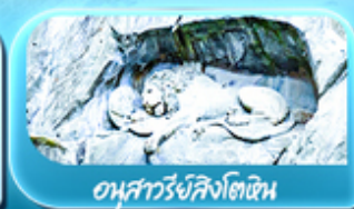
อนุสาวรีย์สิงโตหิน