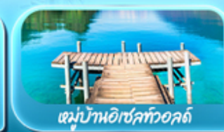
หมู่บ้านอิเชิลทอลล์