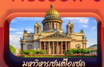
มหาวิหารเซ็นต์ไอแซค