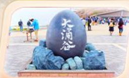
ซุบซาโด้ถ้ำอิวาคุดานิ