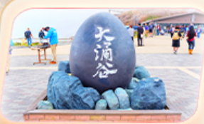
ชุมชนไร่ดำโอวาคุดานิ