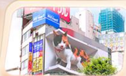
ซ็อบบิงย่านชินจูกุ