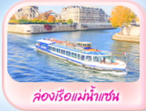
คองรีอแมงน้ำแซน