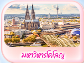
มทาวีฮารโคโลญ