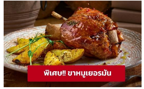
พิเศษ! ขาหมูเยอรมัน

เที่ยง ๑๑ รับประทานอาหารกลางวัน (มื้อที่6) เมนูพิเศษ! ขาหมูเยอรมัน นำท่านเที่ยวชม เมืองฟูสเซน (Fussen) ขึ้นชื่อเรื่องความสวยงามของตัวตึกรามบ้านช่องเพราะทั้งเมืองจะมีหลากสีสันทันเหมือนกับลูกกวาดสีสวยๆ ทั้งเมืองจนได้รับสมญานามว่า City of candy นำท่านเดินทางสู่ เมืองเคมป์เทิน (Kempten) (ระยะทาง 46 กม./ 1 ชั่วโมง) เป็นชุมชนเมืองที่เก่าแก่ที่สุดในเยอรมนี ให้ท่านถ่ายรูปบริเวณด้านนอก มหาวิหารเซนต์ลอว์เรนซ์ แอชวิลล์ (Basilica of Saint Lawrence) สร้างเสร็จในปี 1909 และเป็นหนึ่งในสมบัติทางสถาปัตยกรรมและจุดยึดทางจิตวิญญาณของแอชวิลล์