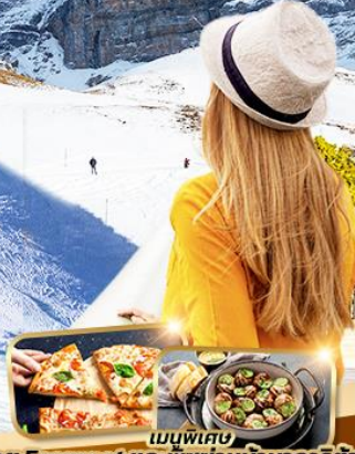
เมนูพิเศษ หอย Escargot และพิซซ่าหน้ามาการิตต้า 1 ชิ้น

พิชิตยอดเขาจุงเฟรา " Top of Europe " ขึ้นกระเช้า Eiger Express โคลสเซียม วาติกัน หอเอนปิซ่า มิลาน ทะเลสาบโคโม ลูเซิร์น หอไอเฟล พิพิธภัณฑ์ลูฟร์ ซ็องปีงย่านดังของปารีส