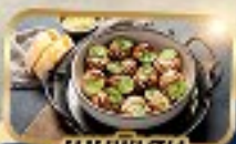
เมนูพิเศษ หอย Escargot