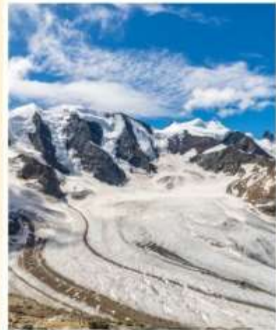
DIAVOLEZZA Piz Bernina Peak