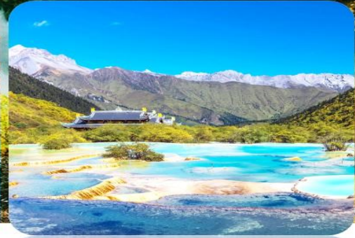
อุทยานหวงหลง

เมนูพิเศษ สุกี้หม่าล่า บุฟเฟต์ ดันตำรับเสฉวน