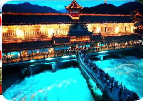
เมืองโบราณตูเจียงเยี่ยน