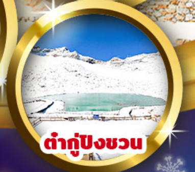
ท่ากู่ปิงชเวน