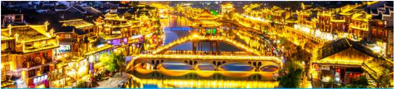
เมืองโบราณฟงหวง

จากนั้นนำท่านเดินทางสู่ เมืองโบราณฟงหวง (เมืองหงส์) 凤凰古城 ใช้เวลาเดินทางประมาณ 2 ชั่วโมง เมืองนี้ตั้งอยู่ในเขตปกครองตนเองของชนเผ่าตู่เจีย ตั้งอยู่ริมแม่น้ำฉางเจียงทางทิศตะวันตกของมณฑลหูหนาน ล้อมรอบด้วยขุนเขาเสมือนด่านช่องแคบภูเขาฟงหวง ตั้งเด่นตระหง่านเสมือนป้อมปราการ ธารน้ำฉางเจียงใสสะอาดราวน้ำบริสุทธิ์ที่ถูกกลั่นกรองจนมองเห็นก้นลำธาร ชุมชนที่เป็นบ้านเรือนจีนโบราณแบบยกพื้นสูงเรียงรายกันริมแม่น้ำ ช่างเป็นทัศนียภาพที่สวยงามมีเสน่ห์ของเมืองโบราณฟงหวง ราวกับดินแดนมนุษย์ที่สร้างอยู่บนสวรรค์.. *** นำท่านนั่งรถเมล์ของเมืองโบราณฟงหวงเข้าสู่โรงแรมในเมืองเก่า * กระเป๋าสัมภาระรวมค่าพนักงานขนจากรถบัสไปโรงแรมแล้ว