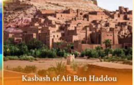
Kasbah of Ait Ben Haddou