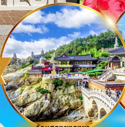
วัดแสงยงกุงซา