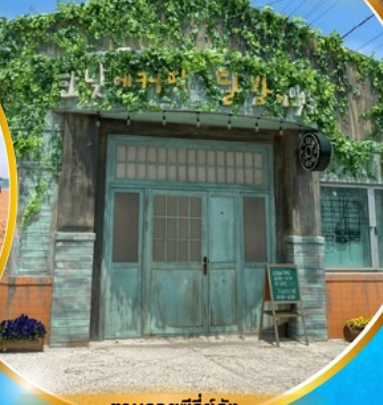
ตามรอยซีรีส์ดัง Hometown chachacha

โพฮังสเปซวอล์ค สกายจอร์ค ตามรอยซีรีส์ Hometown chachacha ถ่ายรูปชิคๆ หมู่บ้านวัฒนธรรมคิมซอน ขึ้นเคเบิลคาร์ ชมทะเลปูซาน นั่งรถไฟปิ๊กปิ๊ก sky capsule ชิมของอร่อยตลาดแฮนแด อิสระช้อปปิ้ง Lotte Duty Free