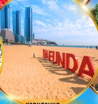
หาดแฮนแด