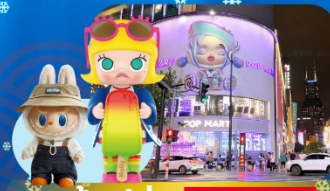
ช้อปปิ้ง POP MART