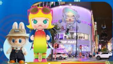
ช้อปปิ้ง POP MART