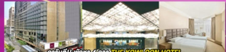
การันตี!! พิเศษ 4 ดาว THE KOWLOON HOTEL ติดถนนนาธาน ย่านช้อปปิ้งจิมซาจู้