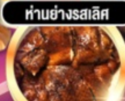
हांอย่างรสเลิศ