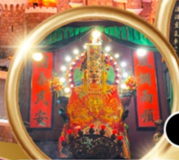
ขอพรซื้อขายอสังหาริมทรัพย์