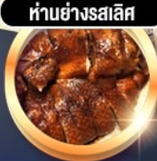
ห่านย่างสไลส