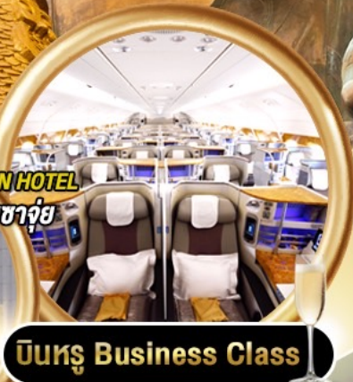
บินหรู Business Class