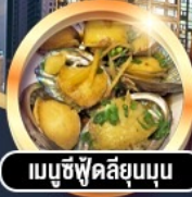
เมมูซี่ฟู้ดสิยุมบุน