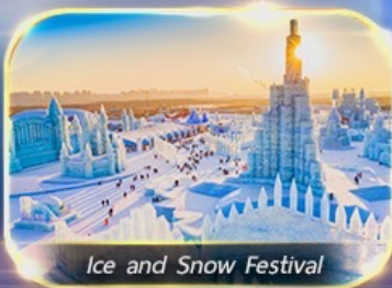
Ice and Snow Festival