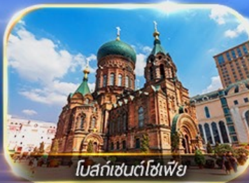
โบสถ์เซนต์โซเฟีย