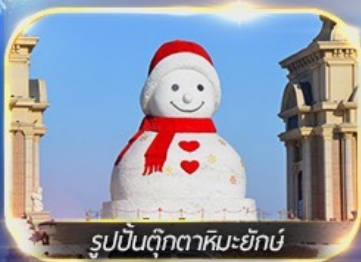
รูปปั้นตุ๊กตาหิมะยักษ์