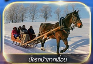
นั่งรถม้าลากเลื่อน

พักหมู่บ้านหิมะ ชมแสงสียามค่ำคืน พรีนั่งรถม้าลากเลื่อน