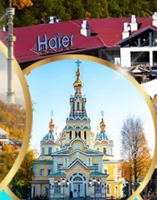
โบสถ์เซนคอฟ