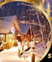
หมู่บ้านเทพนิยาย นิงเกิลเทอร์ส