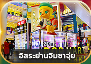
อสังหาริมทรัพย์