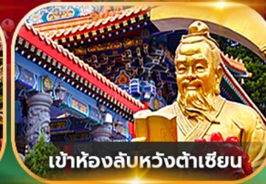
เข้าห้องลับหวังต้าเซียน