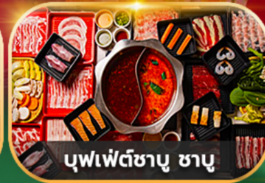
บุฟเฟ่ต์ชาบู ชาบู