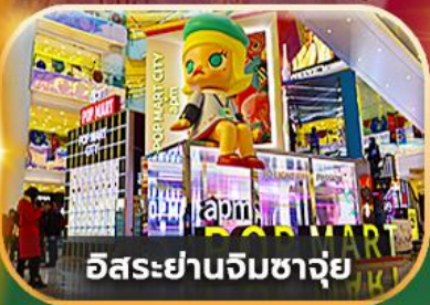
อิสระยานจิมซาจุย