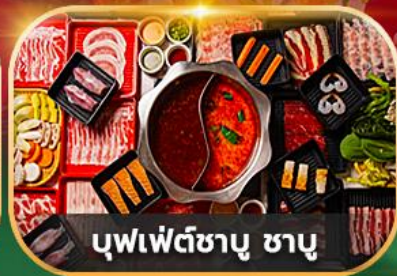
บุฟเฟ่ต์ซาบู ซาบู