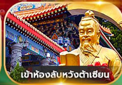
เข้าห้องลับหวังต้าเซียน