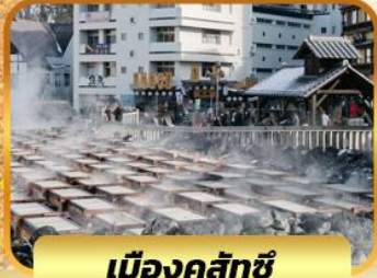
เมืองคุสัทชิ