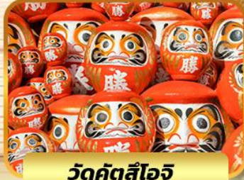
วัดคัตสึโองิ