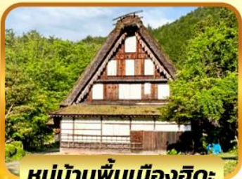
หมู่บ้านพื้นเมืองฮิดะ