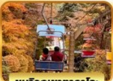
ชมวิวกุเขากาตากาโอะ