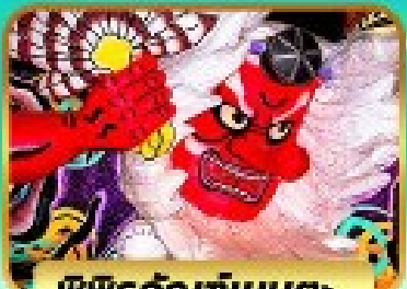
พิพิธภัณฑสถานหุ่นขี้ผึ้ง