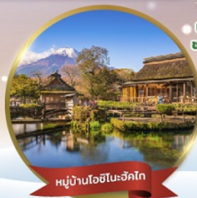
หมู่บ้านโอชิโนะฮักโกะ