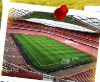
Old Trafford Stadium