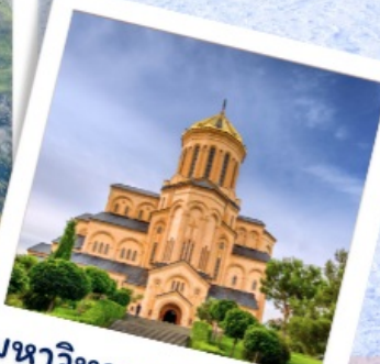
มหาวิหารแห่งทบิลีซี