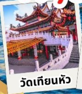
วัดเทียนหัว