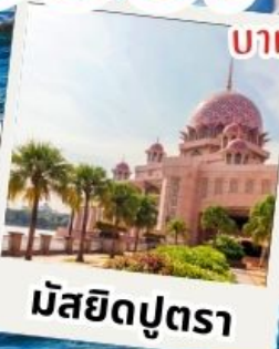
มัสยิดบุตรา