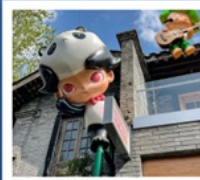
ถนนคนเดินซอยกว้างแคน