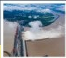
เขื่อนฉินชานเสินต้าฉี

ทัวร์รถกันชน ไปลงร้านฮ้อปเปิง + ไปชายหาดฟงฮัน