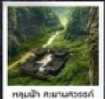
อุทยานหลุมฝังศพพันปี