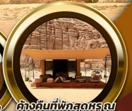
ค้ำคืนที่พักสุดหรู ณ Habitat AlUla 2 คืน

พิเศษ!! รับประทานอาหาร ณ ภัตตาคารอาหารไทย สุดหรูและไฮโซ @Saffron Banyan Tree AlUla