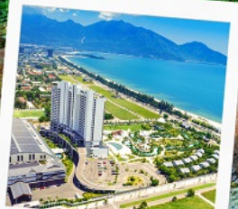
Mikazuki Japanese Resorts & Spa