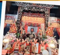
เทพเจ้ากวนอู วัดกวนไท่