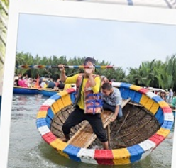
เรือกระด้ง