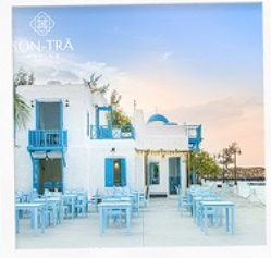
ซานตารีนาคาเฟ่