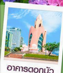
อาคารตอกบัว