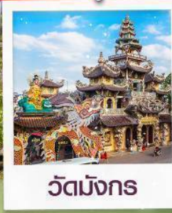
วัดมังกร