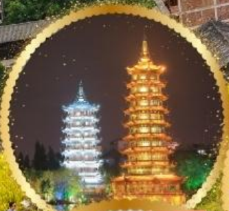
เจดีย์เงิน เจดีย์ทอง