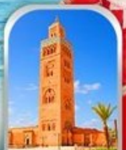
JEMAA EL-FNAA MARRAKESH