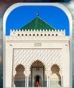
MOHAMMED V SQUARE