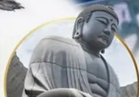
ชมเนินพระพุทธรเจ้า Hill of the Buddha

📍 ไฮไลท์!! สนุกสนานกับกิจกรรมทะเลหิมะ ณ ลานสโนว์ เวิลด์ ฮักไซฟาโนรามา เยี่ยมชมเนินพระพุทธรเจ้า ชมความน่ารักเหล่าสัตว์ ณ สวนสัตว์อาซาฮิยาม่า ชมคลองโอดารุ เข้าชมพิพิธภัณฑ์ถ้ำสองดนตรี สัมผัสธารน้ำแข็ง ณ หมู่บ้านราเมนอาซาฮิยาม่า ช้อปบิงจูกุ กาบุคิโคโนะ อีเมอร์ออย!! บุปเฟ่ต์ซาบู และซาบูยูกัน