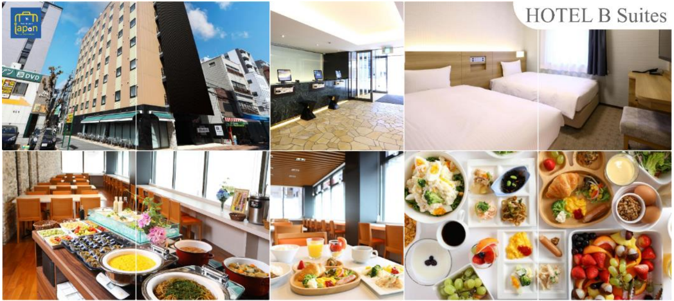
HOTEL B Suites

HOTEL B SUITES NAMBA, OSAKA หรือเทียบเท่าระดับเดียวกัน