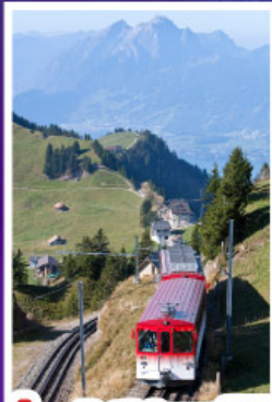
นั่งรถไฟใต้เขาเรริก