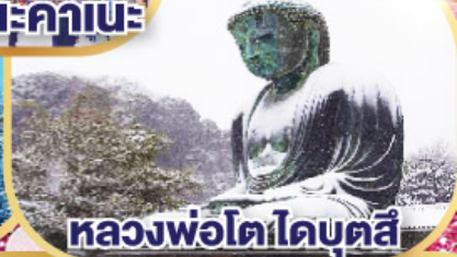
หลวงพ่อดอโดบุตสึ