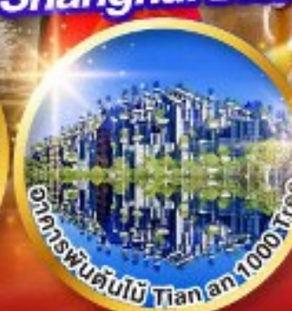
อาคารพันต้นไม้ Tiananmen 1000tree