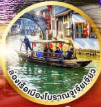
ล่องเรือเมืองโบราณซูโจว